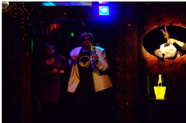
TOURNEE 2009 : Théâtre des Poissons, Espace Culturel Picasso – Longueau, Santerre...